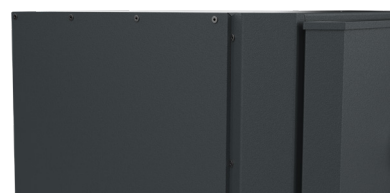
FINITION RIVETÉE SPÉCIALE « ACIER GALVANISÉ ANTI-ROUILLE »